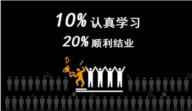
图1 学堂在线MOOC魅力测量报告截图1。

根据“2015年清华大学知识青年烔论坛”上分享的“MOOC魅力测量报告”可以了解到“10个人里1个认真学习,5个人里1个修成正果”,尽管注册学生人数庞大,但是真正能够坚持学习并顺利完成课程的学习者并不多,在课程的学习过程中存在极高的辍学率。