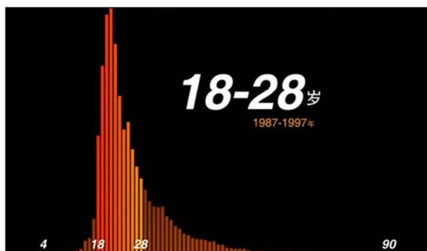
图3 学堂在线MOOC魅力测量报告截图2。

根据“2015年清华大学知识青年烔论坛”上分享的“MOOC魅力测量报告”可以看出，国内MOOC平台的用户群体主要集中在18-28岁之间，以90后为主要用户群体。而且以18-25岁的用户学习认真的人数最多。