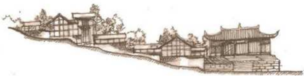
4 内城门外侧坡下空间