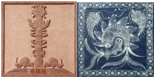
图1 布依族图腾文化。

在镇山村布依村寨建筑各处均可看到大小不一的图腾,或具有装饰效果或有一种特殊意义,不少布依族居民在自家民居的门檐、栏杆、门框、庭院桌柱脚等位置绘制雕刻图案,常以龙凤图案为主,代表了当时人们祈求风调雨顺的思想[3]。布依族是一个勤劳的少数民族,背山而筑面水而居,因此牛的身影也常常出现在他们的生活当中,被村民们当做守护神,保佑家族的平安。布依人的服饰精美绚烂,上面的图案也尤为精细,不少服饰上面均以鱼形图案来绘制,代表了当地居民祈求幸福安康,吉祥如意的美好愿望。不管是建筑上的图腾还是生活中的图腾,布依人用自己的智慧创造出了属于他们自己的精神财富以及对未来美好生活的向往,然而特殊的图案标志也成为了布依人久久不能舍弃的文化财富。(如图1)