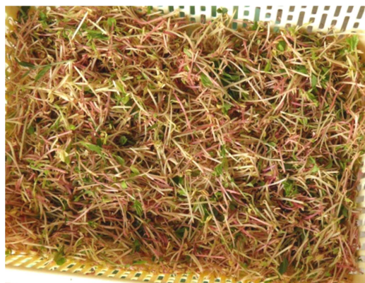
图4 采摘的胎茶原料苗。

郭春芳等研究说明不同土壤水分处理对茶树净光合速率( P_n )、蒸腾速率( Tr )、气孔导度( G_s )、 WUE 等生理指标及其日变化均产生明显影响以及水分胁迫下茶树的 P_n 、 Tr 、 G_s 都下降, WUE 日平均值的降幅比 P_n 的小[5]。而本次研究中没有深入涉及这方面的内容。